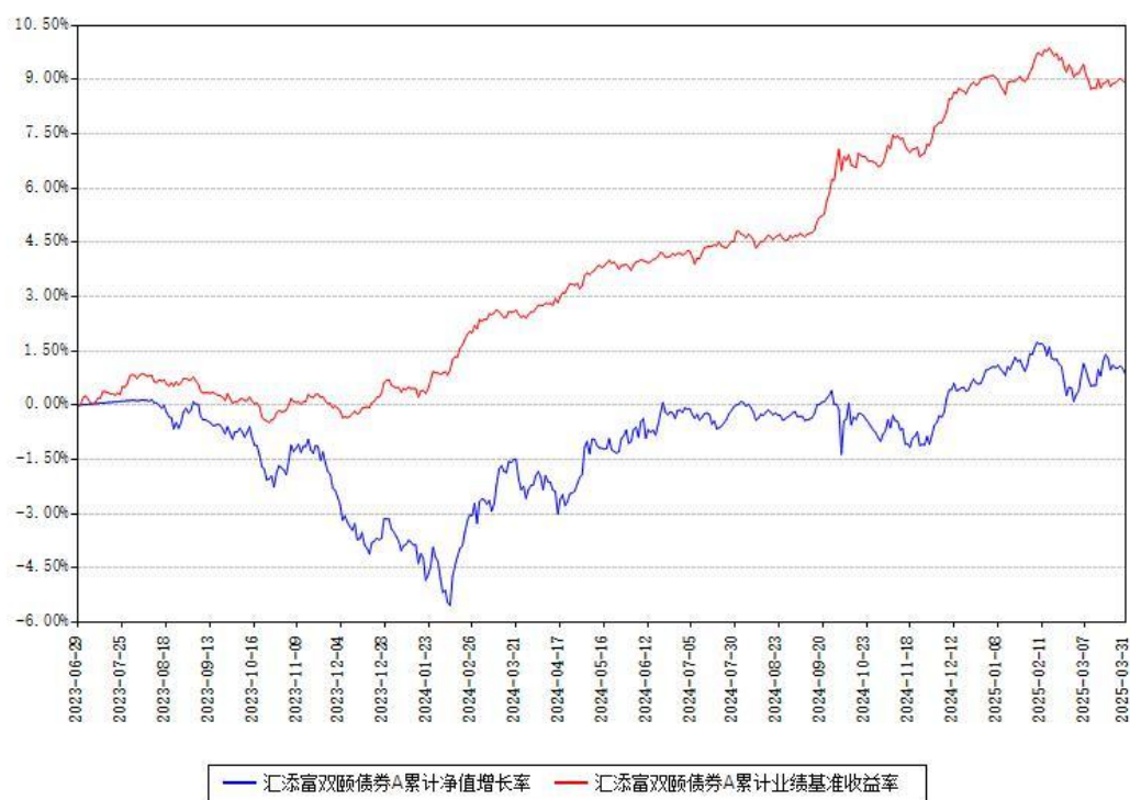
汇添富双颐债券A累计净值增长率与同期业绩基准收益率对比图

(二)自基金合同生效以来基金累计净值增长率变动及其与同期业绩比较基准收益率变动的比较图