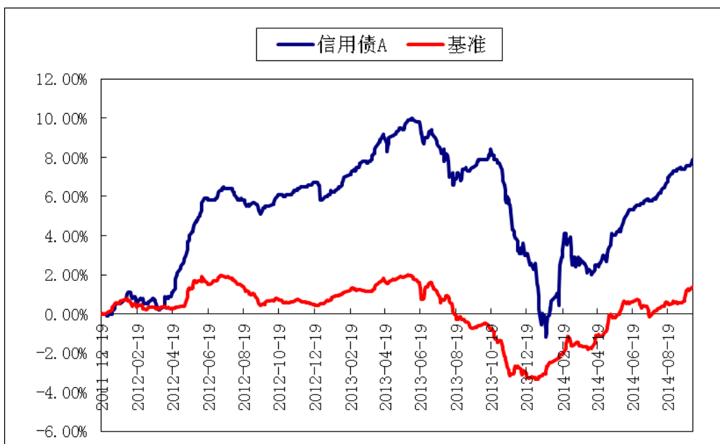
汇添富信用债债券 C